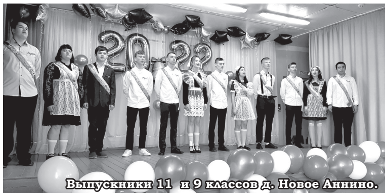
Выпускники 11 и 9 классов д. Новое Аннино.