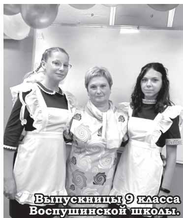
Выпускницы 9 класса Воспушинской школы.

Последний звонок – возможность для выпускников сказать спасибо учителям. Строгие и добрые, требовательные и верные своей профессии, они все эти годы были рядом, передавали свои знания, наставляли, воспитыва-