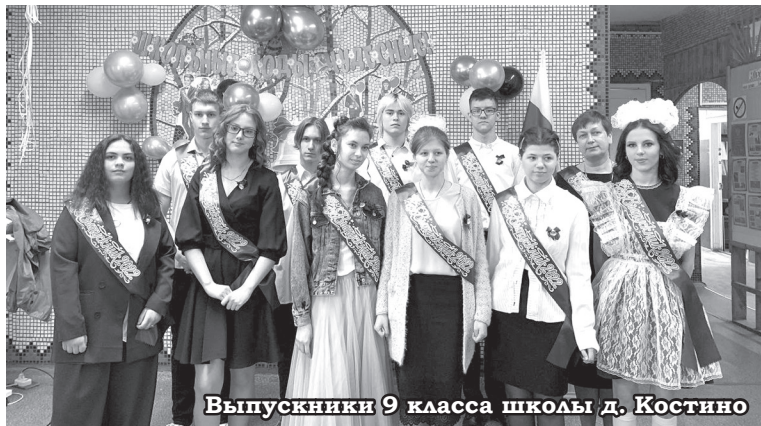
Выпускники 9 класса школы д. Костино

Электронная версия газеты – на сайте petushkisp.ru